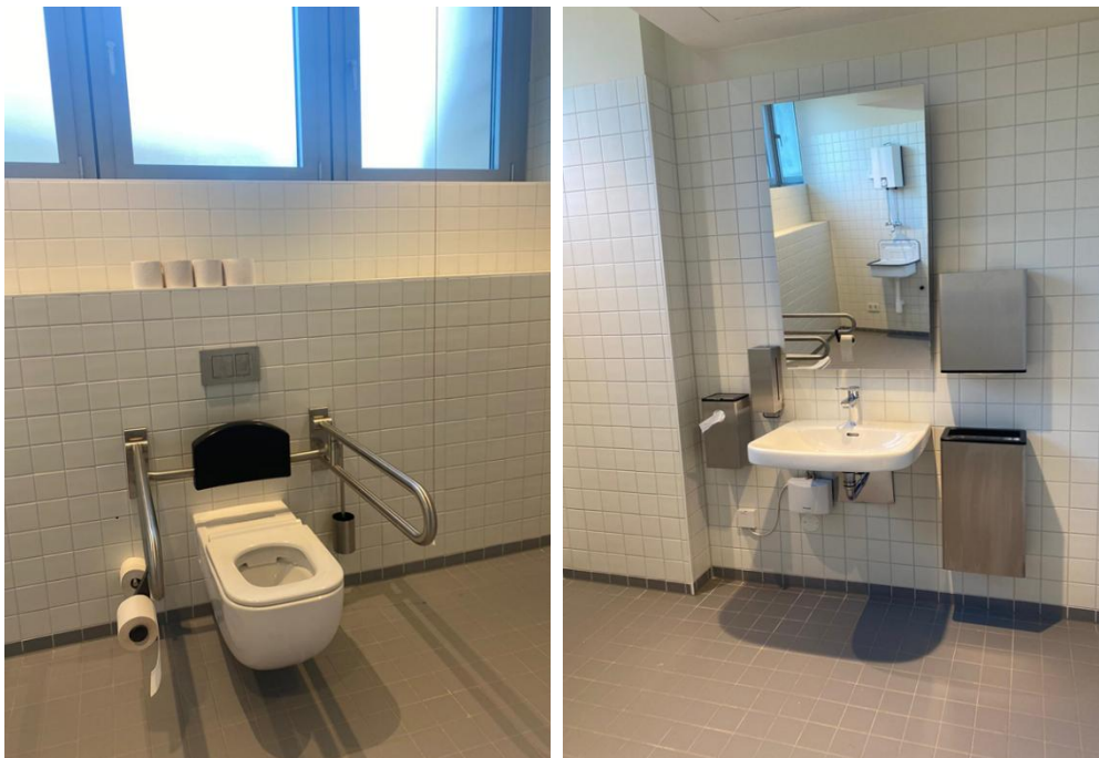
Abbildung 18: Fotos des WCs für Menschen mit Behinderungen im 10.OG des VMP 6

Bemerkungen: links neben den Waschbecken gibt es einen kleinen, an der Wand befestigten Mülleimer für hygienische Produkte