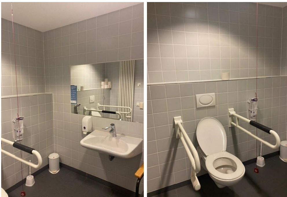
Abbildung 20: Fotos des WCs für Menschen mit Behinderungen im 2.OG der Martha-Muchow-Bibliothek

Bemerkung: Toilettenspülung hinter der Toilette (in 100cm Höhe)