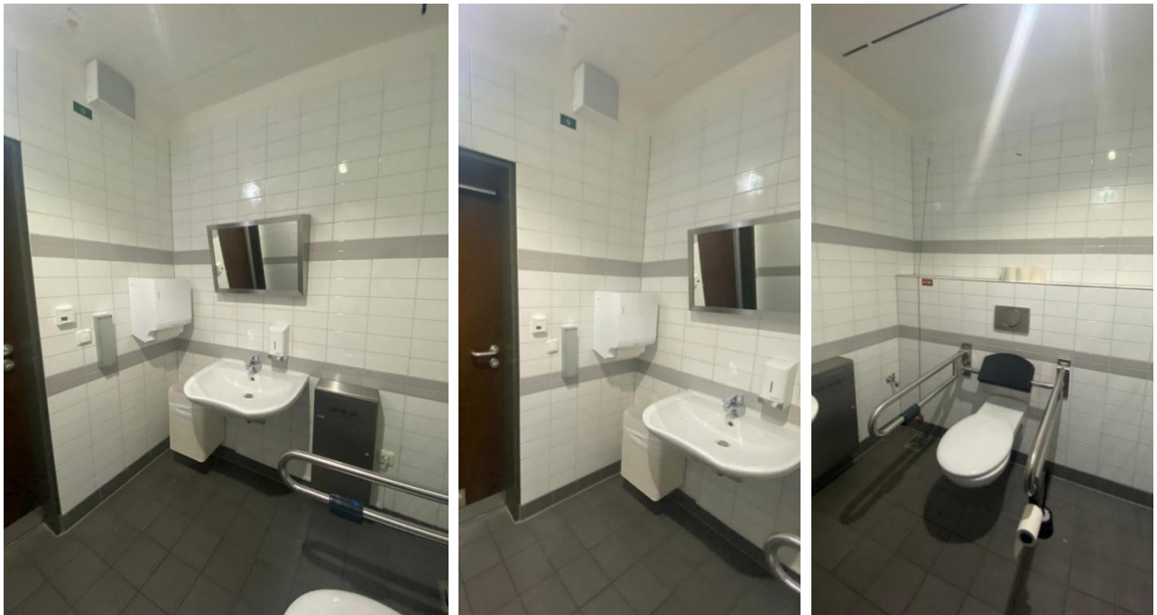
Abbildung 10: Fotos des WCs für Menschen mit Behinderungen im 1.OG des VMP 3 Stabi Neubau