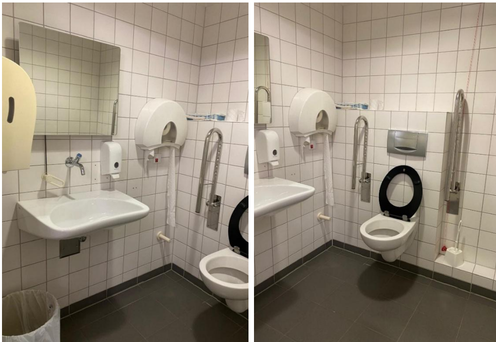
Abbildung 5: Fotos des WCs für Menschen mit Behinderungen im 2.OG des ESA 1 Flügelbau West, Herren