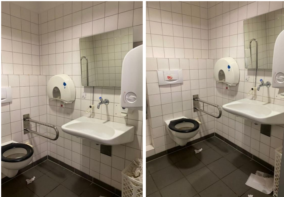
Abbildung 2: Fotos des WCs für Menschen mit Behinderungen im EG des ESA 1 Flügelbau West, Damen