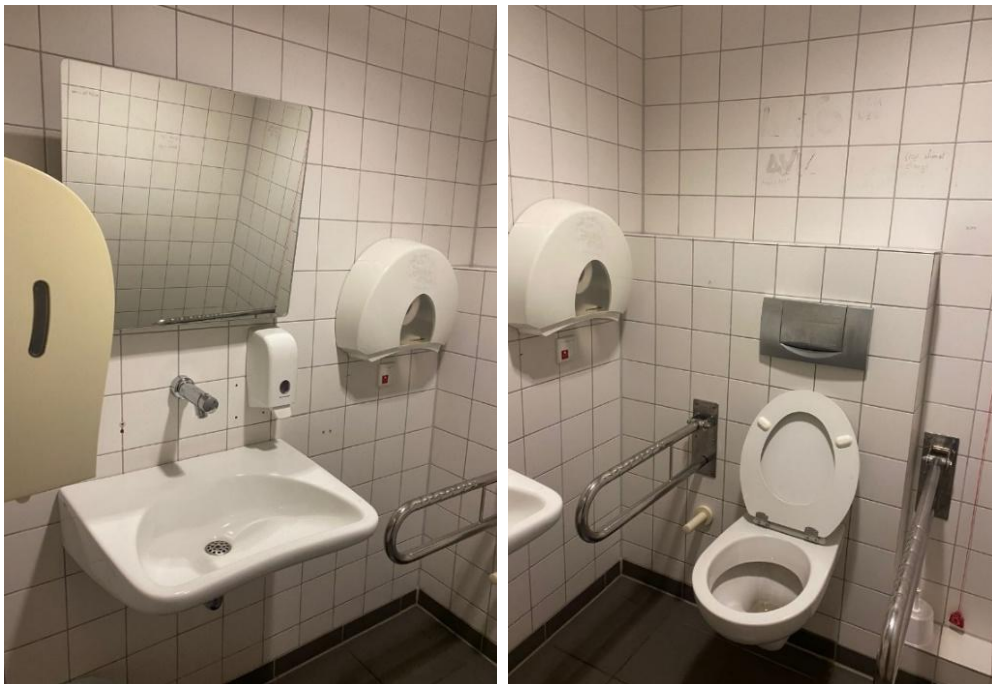
Abbildung 8: Fotos des WCs für Menschen mit Behinderungen im EG des ESA 1 Flügelbau Ost, Herren (eigene Fotos des Büros für die Belange von Studierenden mit Beeinträchtigungen)