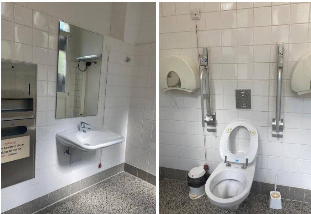
Abbildung 21: Fotos des WCs für Menschen mit Behinderungen im EG des VMP 9

Bemerkung: Toilettenspülung links und rechts in den Haltegriffen integriert, separater Toiletten- und Waschraum (Vorraum)