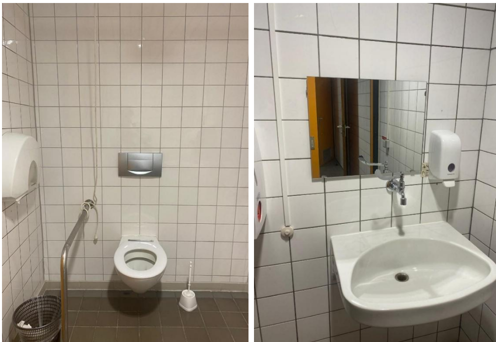
Abbildung 13: Fotos des WCs für Menschen mit Behinderungen im EG des VMP 5, Damen

Bemerkungen: Toilette ist in die Damentoilette integriert, die Türbreite des Durchgangs zur Toilette für Menschen mit Behinderung beträgt 79cm