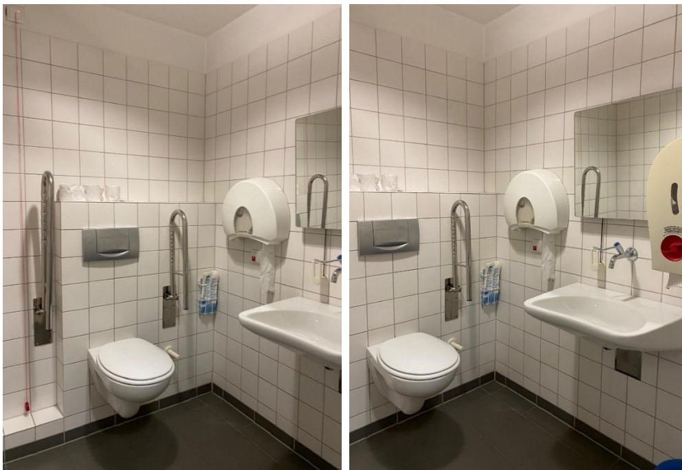
Abbildung 3: Fotos des WCs für Menschen mit Behinderungen im 2.OG des ESA 1 Flügelbau West, Damen