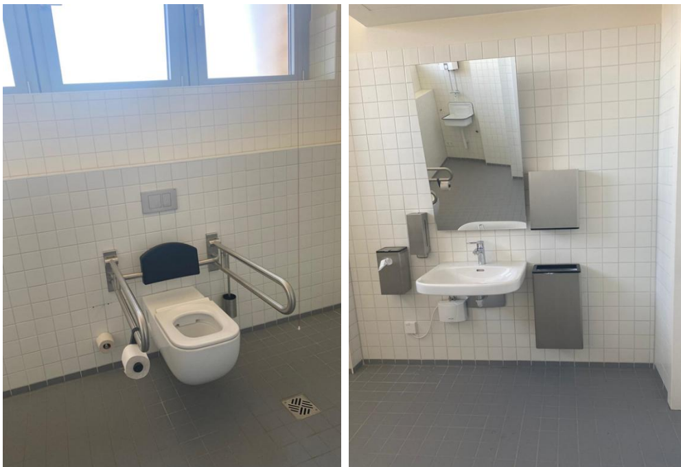
Abbildung 17: Fotos des WCs für Menschen mit Behinderungen im 2.OG des VMP 6

Bemerkungen: links neben den Waschbecken gibt es einen kleinen, an der Wand befestigten Mülleimer für hygienische Produkte