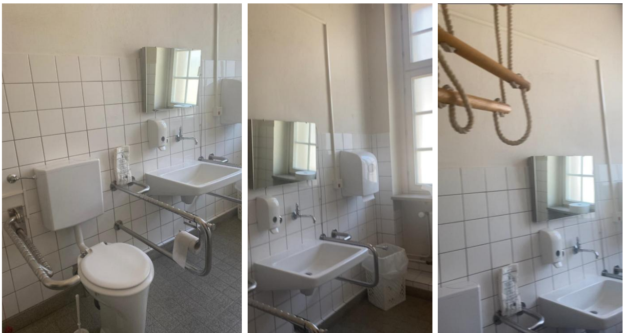
Abbildung 1: Fotos des WCs für Menschen mit Behinderungen im 1. OG des ESA 1 Hauptgebäude.