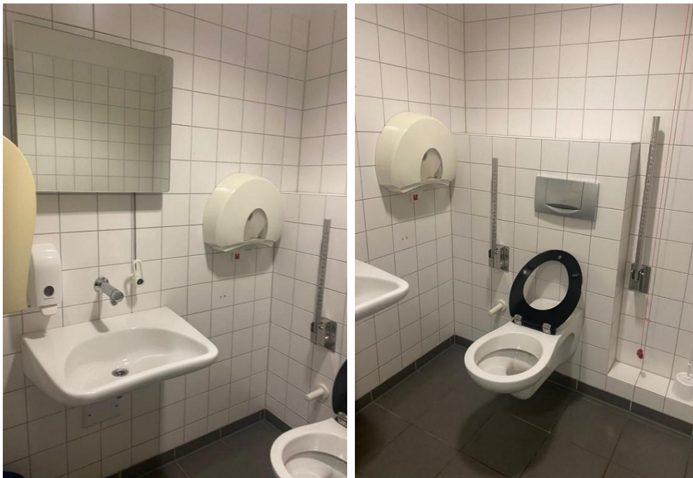
Abbildung 9: Fotos des WCs für Menschen mit Behinderungen im 2.OG des ESA 1 Flügelbau Ost, Herren