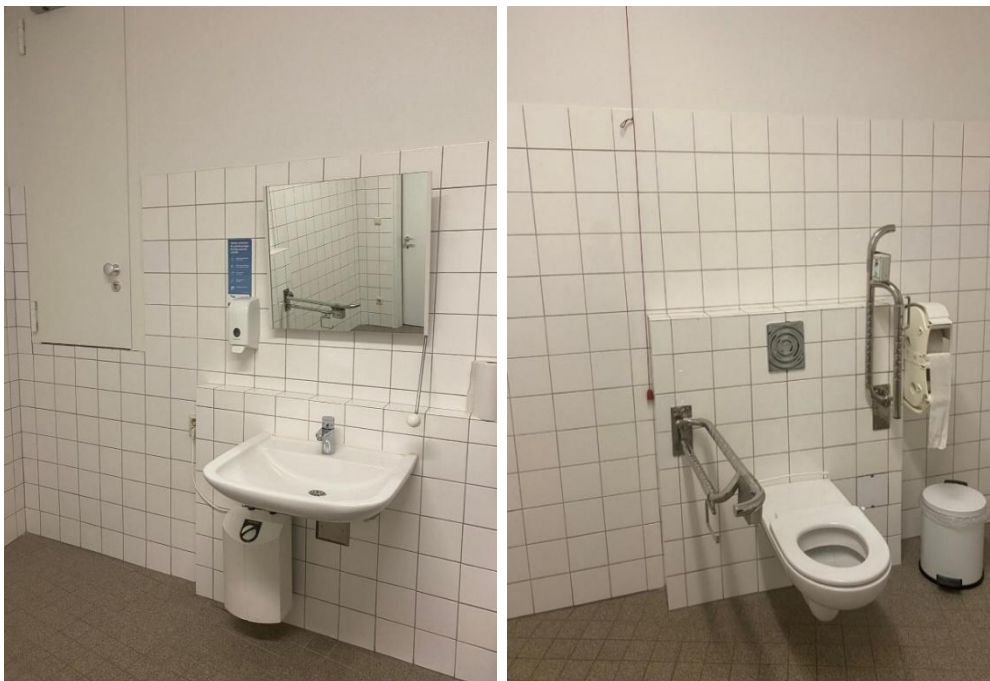
Abbildung 12: Fotos des WCs für Menschen mit Behinderungen im EG des VMP 4 Audimax

Bemerkungen: sehr großer Raum, Türöffner innen öfter drücken, Spülung befindet sich rechts und links an den Handläufen