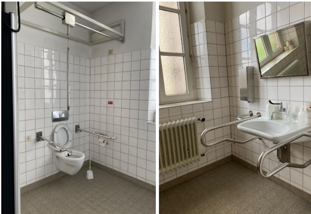
Abbildung 11: Fotos des WCs für Menschen mit Behinderungen im 2.OG des VMP 3 Stabi Altbau