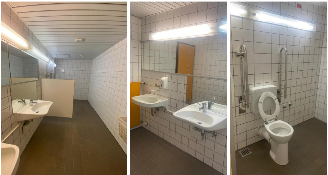
Abbildung 15: Fotos des WCs für Menschen mit Behinderungen im 1.OG des VMP 5

Bemerkungen: die Türbreite des Durchgangs zur Toilette beträgt 79 cm