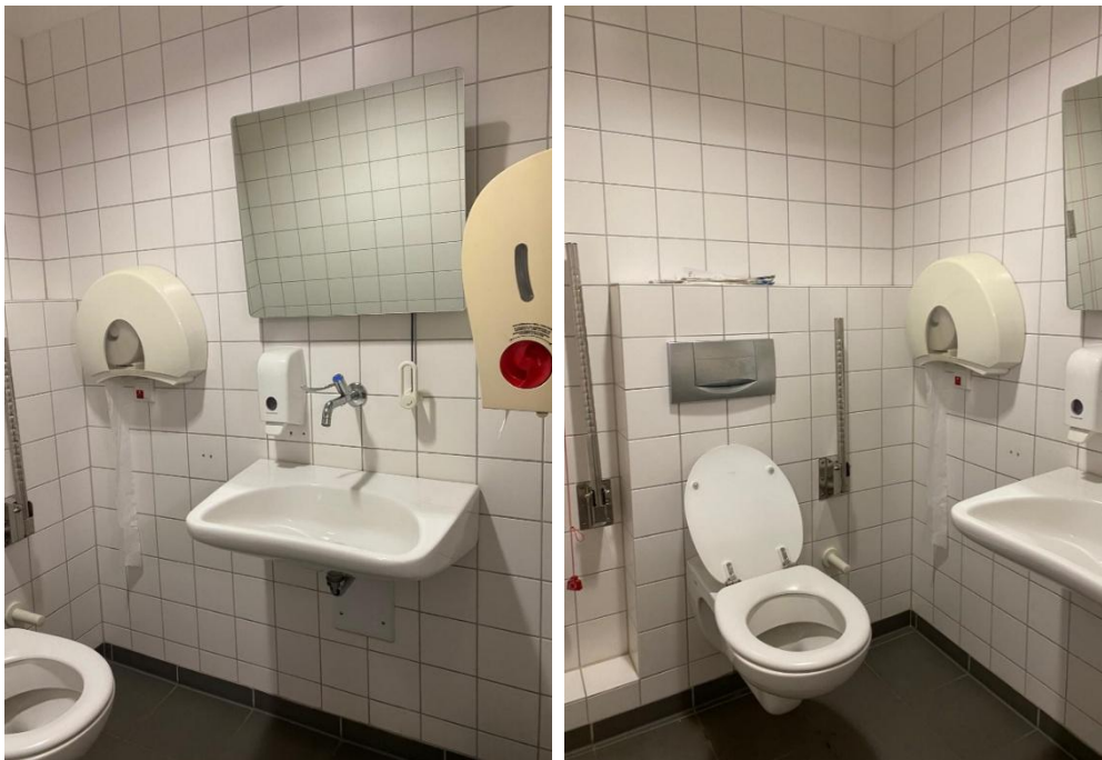
Abbildung 7: Fotos des WCs für Menschen mit Behinderungen im 2.OG des ESA 1 Flügelbau Ost, Damen