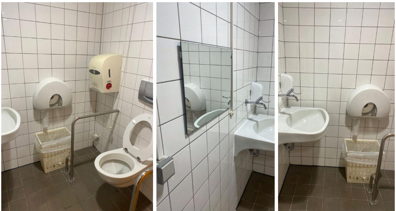
Abbildung 14: Fotos des WCs für Menschen mit Behinderungen im EG des VMP 5, Herren

Bemerkungen: Toilette ist in die Herrentoilette integriert, der Raum ist sehr eng