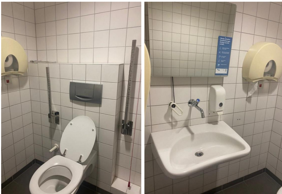
Abbildung 6: Fotos des WCs für Menschen mit Behinderungen im EG des ESA 1 Flügelbau Ost, Damen