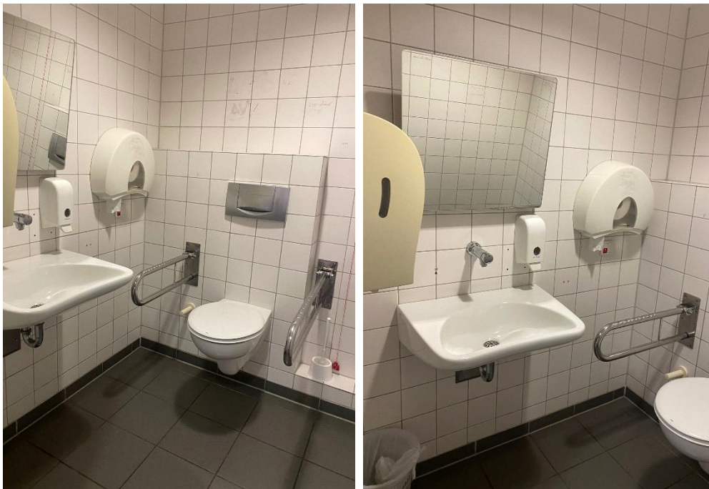
Abbildung 4: Fotos des WCs für Menschen mit Behinderungen im EG des ESA 1 Flügelbau West, Herren