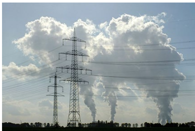
Stromsparen führt nicht automatisch zu weniger Treibhausgasen.