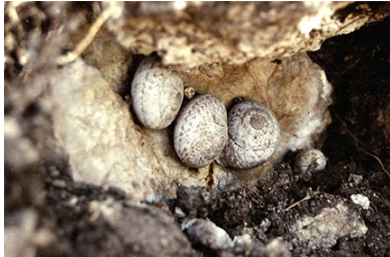
Die Kreuzritter-Schnecke Levantina spiriplana auf Rhodos, hier in Spalten von Kalkfelsen bei Kamiros.