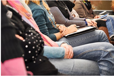
Am 29. September steht alles im Zeichen der Karriereplanung in der Wissenschaft.