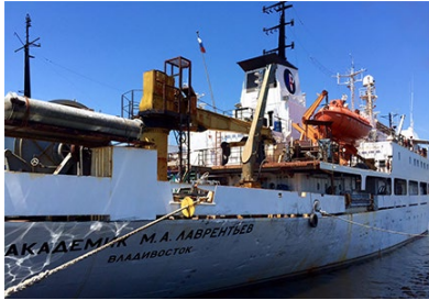
Das Forschungsschiff RV Akademik M.A. Lavrentyev.