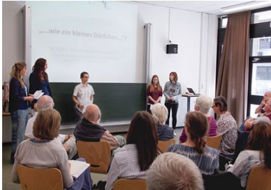
Im Projektbüro Angewandte Sozialforschung helfen Studierende gemeinnützigen Einrichtungen.