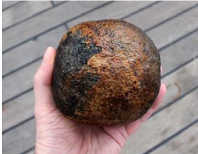
Eine der größeren Manganknollen, die auf der Jungfernfahrt des FS SONNE aus dem Atlantik geborgen wurden.