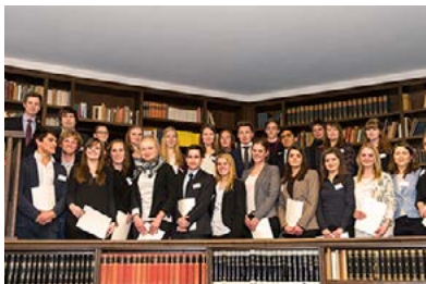
Feierliche Verleihung im Warburg-Haus: Im Januar erhielten die ersten 26 Deutschlandstipendiatinnen und -stipendiaten ihre Urkunden.