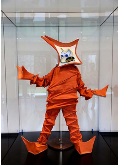
Das „Springvieh“, ein Kostüm der Maskentänzer Lavinia Schulz und Walter Holdt. Leihgabe des Museums für Kunst und Gewerbe, zu Besuch im Mittelweg.