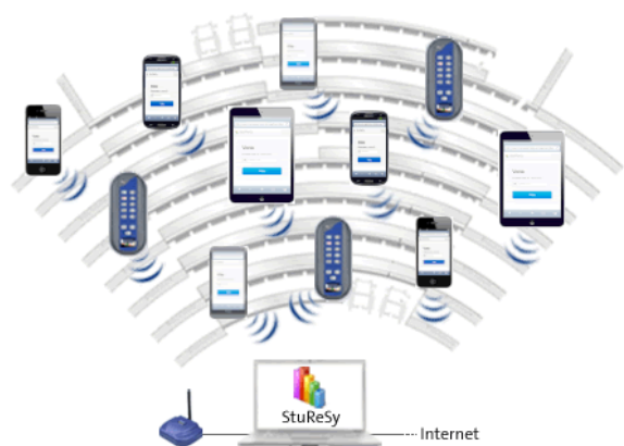
HA unterstützen zunehmend auch Rückmeldungen per internetfähigem Mobilgerät, wie beispielsweise StuReSy

Der Computer der Lehrperson sammelt - bei klassischen HA mit einem Empfänger am Rechner der Lehrperson, bei neueren Lösungen via Internet - die abgegebenen Stimmen und wertet mit Hilfe einer spezifischen Software die Antworten der Studierenden aus. Innerhalb weniger Augenblicke kann eine Visualisierung der Ergebnisse generiert und projiziert werden.