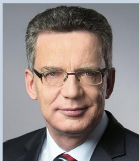
Thomas de Maizière